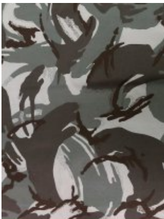
Рисунок № 296