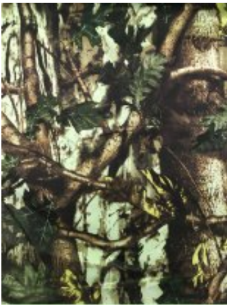
Рисунок № 5913