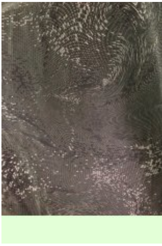
Рисунок № 127