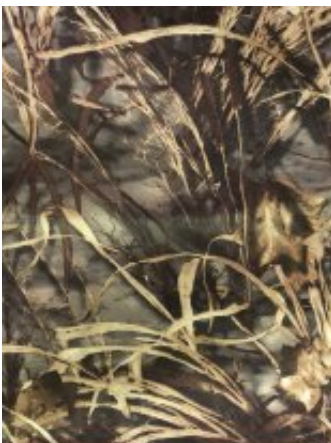
Рисунок № 7714