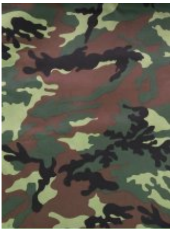
Рисунок № 287