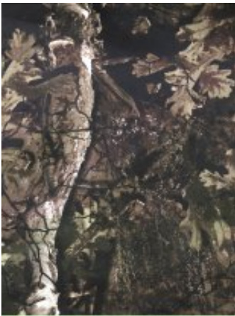
Рисунок № ДУБОК-4