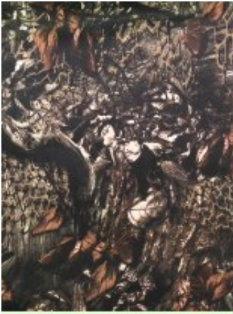
Рисунок № 604