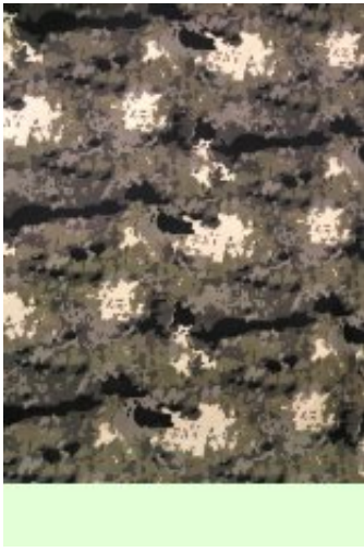
Рисунок № 126