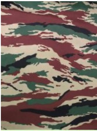
Рисунок № 200 ЗЕЛЁНЫЙ