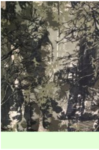
Рисунок № 148