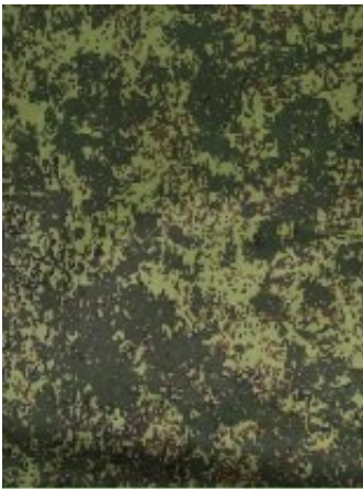
Рисунок № D5