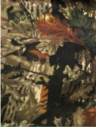
Рисунок № ДУБОК-3