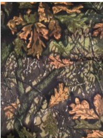
Рисунок № ДУБОК-1