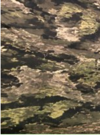
Рисунок № С121