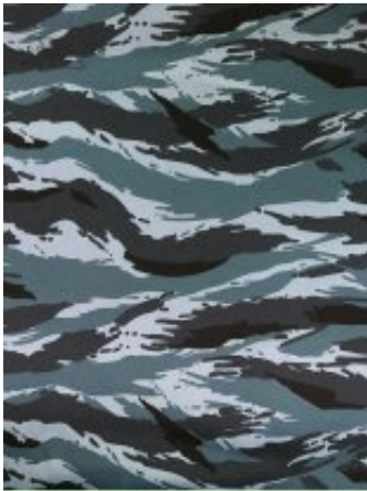
Рисунок № 200 СЕРЫЙ