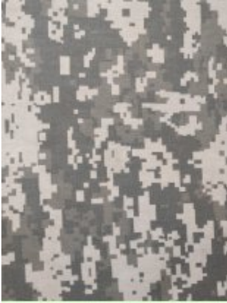
Рисунок № 608