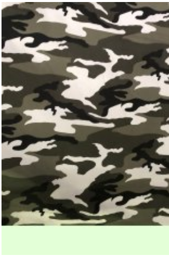
Рисунок № 53