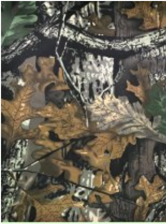
Рисунок № ДУБОК-2