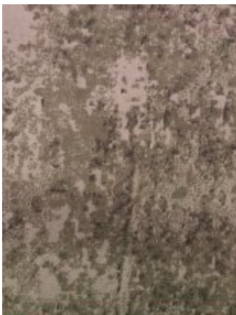
Рисунок № 128