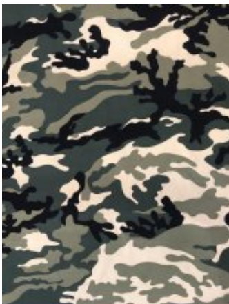
Рисунок № 009