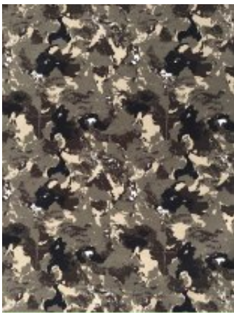
Рисунок № 005