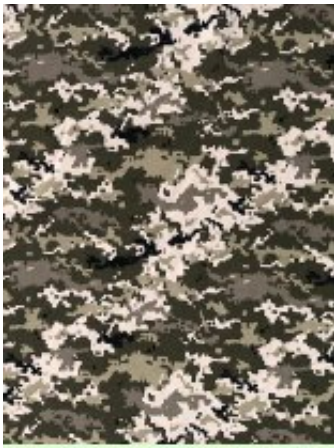
Рисунок № 008