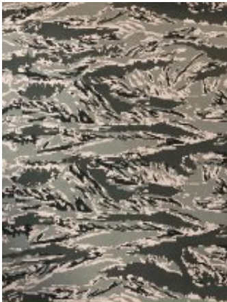
Рисунок № D15