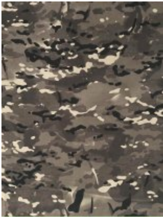
Рисунок № 002