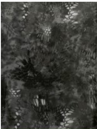
Рисунок № D18