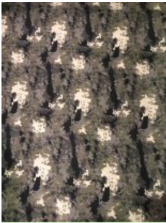
Рисунок № С126