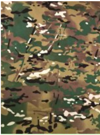
Рисунок № 110-5